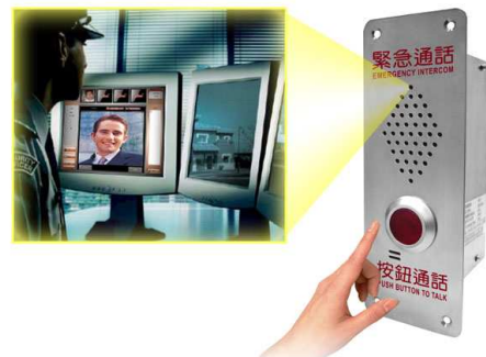
緊急通話器(內建隱藏式攝影機)