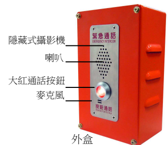
外盒 2mm 厚, 2.05 KG, 150x102x250mm (H*W*L)